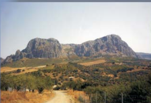
Tajos Gomer y Doña Ana, Ruta de los Tajos